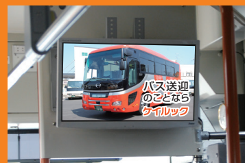
車内の特設モニター

「KLOOK VISION」は、ケイルックが運行する路線バスR' EX、hoop、京都観光ループバスK' LOOPの車内モニターに企業様・店舗様の静止画を運行中配信します。車内には、特設モニター(1車両2~5台)を設置！露出頻度が高く、かつ地元に関わりなく密着したメディアとして、様々な告知やPRをする事が可能です。